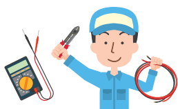
電気設備・通信設備工事費