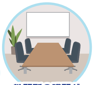
教習所の講習が ない時間