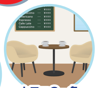
カフェの一角 など など…