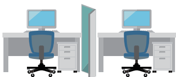
パーティション等の設置費