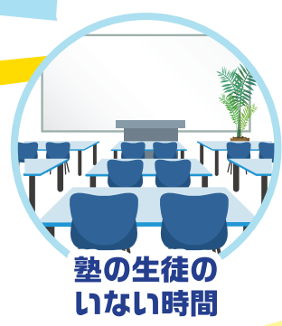
塾の生徒の いない時間