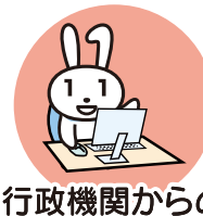
行政機関からの お知らせ・各種証明書